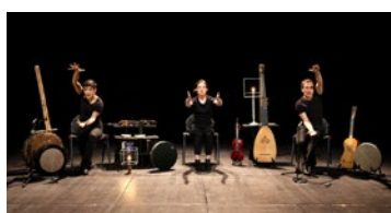
« La belle au bois dormant », colubique.