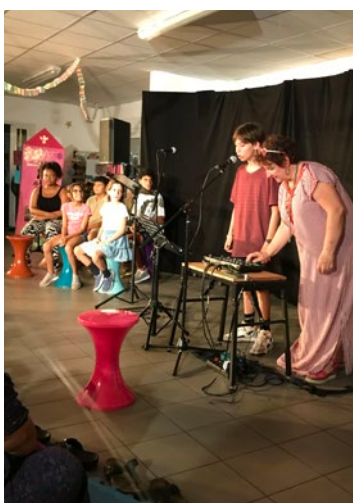
Les ateliers de Moulin Joli ont permis au groupe de femmes de porter des textes leur tenant à cœur et aux ados d'exprimer leur créativité musicale devant les habitants du quartier.