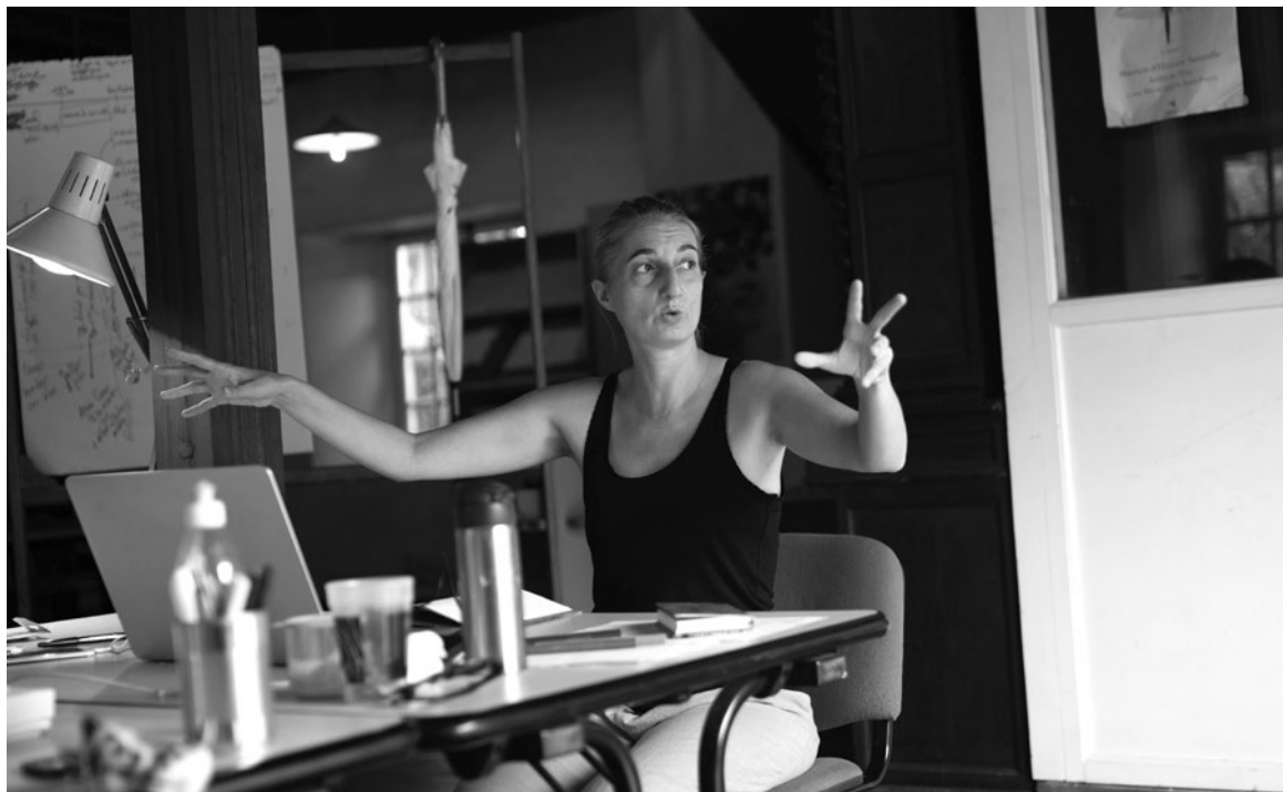
2021 - Résidence Patrimoine et création de 6 mois à Mascarin, jardin botanique de La Réunion Recherche, écriture et création d'un spectacle.