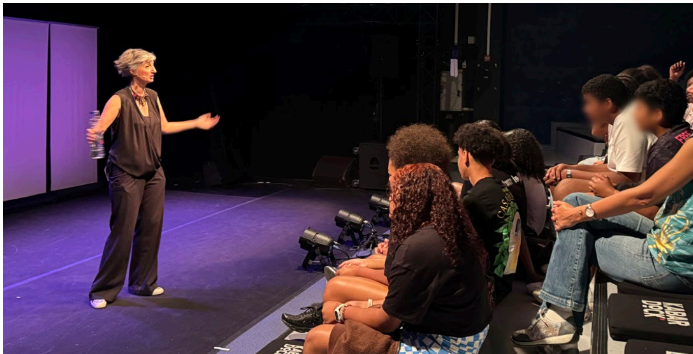
En amont des ateliers au sein de leur collège, échanges avec une classe de 4 ème ayant découvert la restitution de la résidence au Kabardock.

Aperçu du support iconographique de la mini-conférence de l'atelier 4.