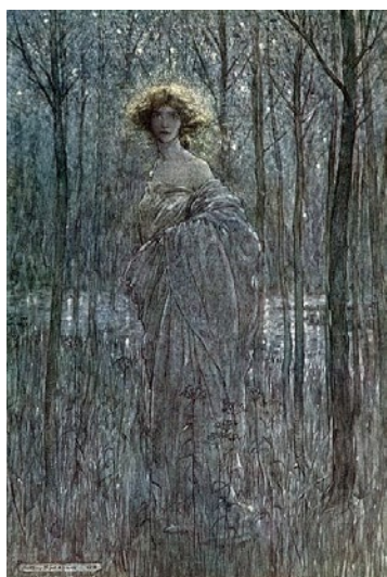
Arthur Rackham - Un rêve de nuit d'été pour l'ambiance nocturne surnaturelle